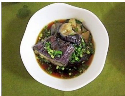
Nasu no nibitashi