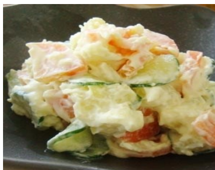
Salade pomme de terre